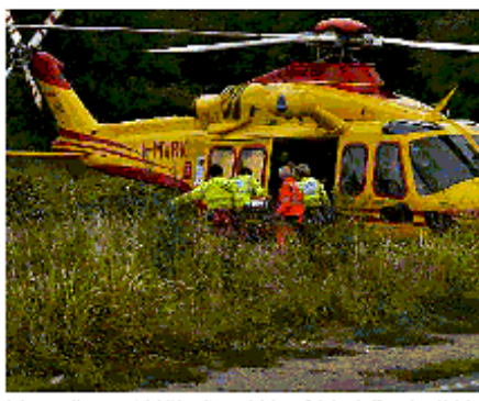
Sul posto gli operatori del 118 e gli agenti della polizia locale