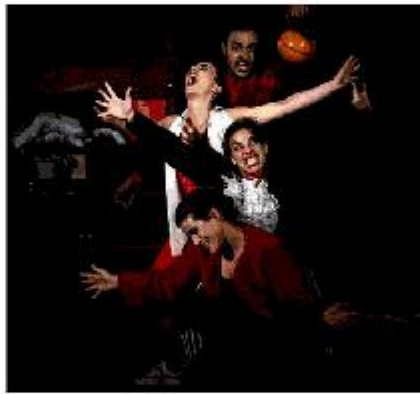
Un'immagine della nuova produzione, 'Eretica', con la regia di Marco Luciano

DUE NUOVE PRODUZIONI: 'Il tempo del canto' ha la regia di Cora Herrendorf , 'Eretica' di Marco Luciano