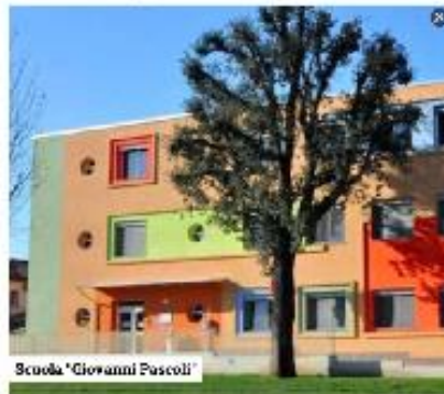
Scuola "Giovanni Pascoli"